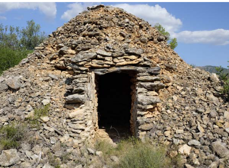
Cocó. Construcció de pedra seca per a la recollida i emmagatzematge d'aigua (Consorti per al Desenvolupament del Baix Ebre i Montsià).