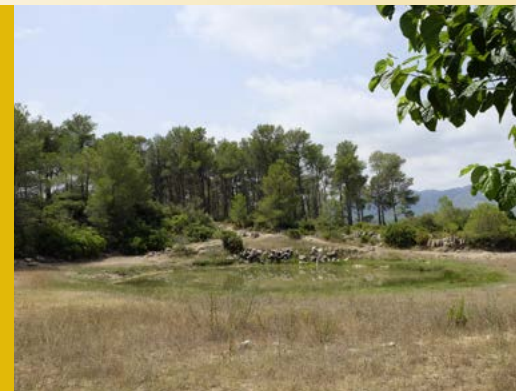
Bassa o abeurador que afavoreix la flora i la fauna de l'entorn (Consorci per al Desenvolupament del Baix Ebre i Montsià).