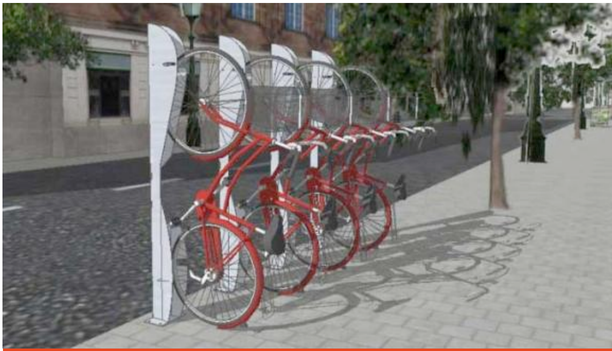
Exemple del sistema a l'espai públic

L'empresa Semab patenta un sistema per aparcar bicicletes de forma segura